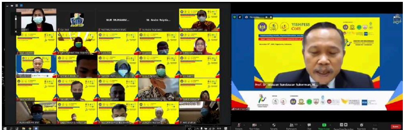
Gambar. Opening Ceremony