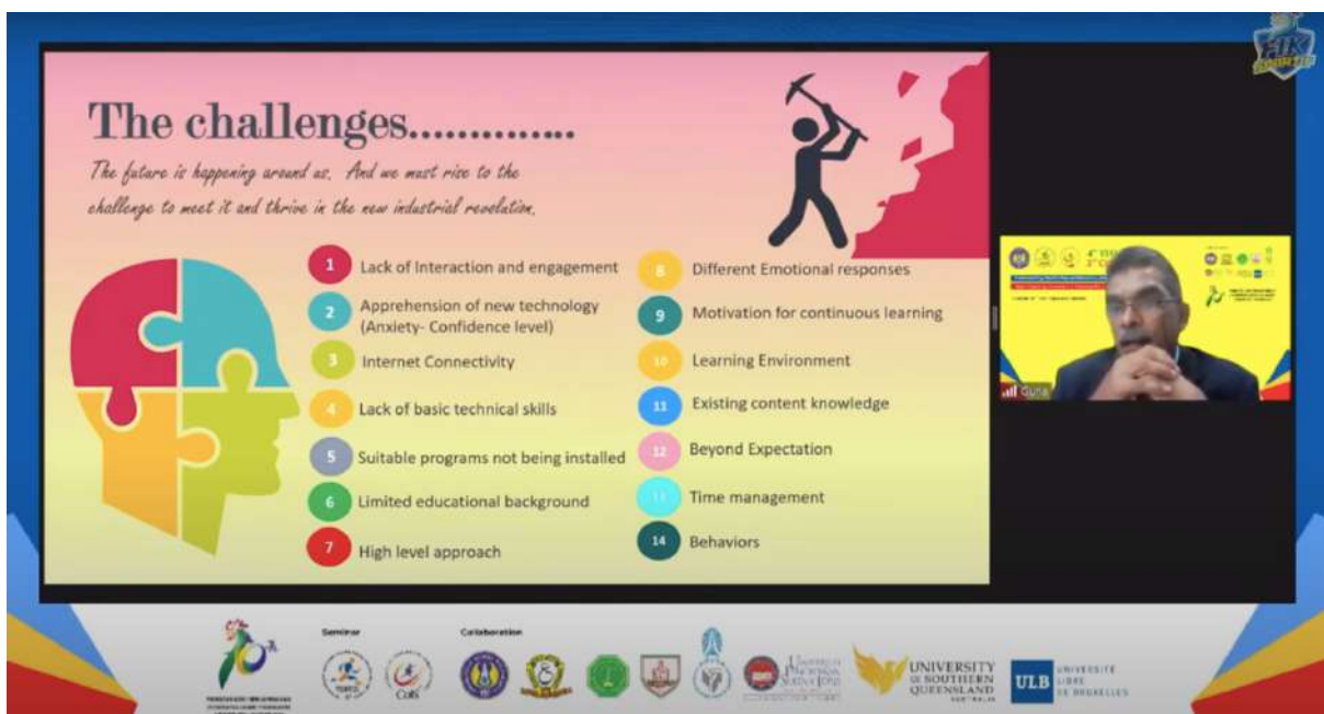
Gambar. Plenary Session